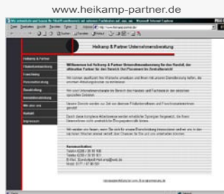
Benutzerdefiniertes Design Kombination aus Strukturen und Farben

Bei einem benutzerdefinierten Design werden Strukturen und Farben so gewählt und untereinander verändert, dass Ihr Webdesign zum Unikat wird.